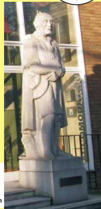
Estatua de Baden-Powell que está frente a "B-P House" en Londres esculpida por Don Potter en 1960.

El Círculo Scout les da la más cordial de las bienvenidas a éste nuevo ejemplar de 360° , hemos trabajado desde principios de junio del 2011 en confeccionar un programa de artículos para nuestra revista y que ya estamos desarrollando, pero seguimos buscando nuevos temas que le sean de interés a nuestros lectores, y también queremos mostrar parte de la colección de los socios senior del Círculo Scout para dar a conocer la riqueza, calidad y la gran variedad de materiales que poseemos los coleccionistas Scouts de México, todo esto en rumbo a nuestro gran encuentro de coleccionistas Scouts en el 2012 .