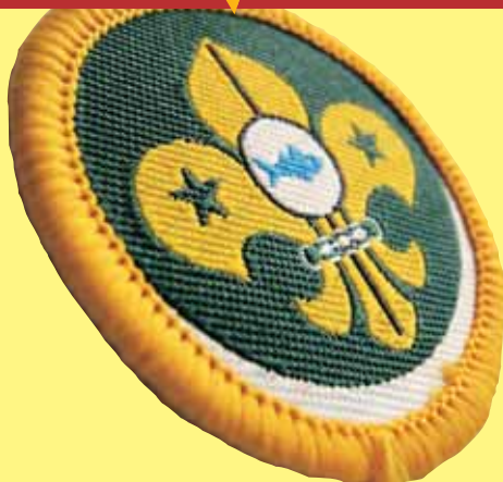
Insignia de compromiso de las Maldivas

El Círculo Scout les da la más cordial de las bienvenidas a éste nuevo ejemplar de 360° , hemos trabajado desde principios de junio del 2011 en confeccionar un programa de artículos para nuestra revista y que ya estamos desarrollando, pero seguimos buscando nuevos temas que le sean de interés a nuestros lectores, y también queremos mostrar parte de la colección de los socios senior del Círculo Scout para dar a conocer la riqueza, calidad y la gran variedad de materiales que poseemos los coleccionistas Scouts de México, todo esto en rumbo a nuestro gran encuentro de coleccionistas Scouts en el 2012 .