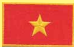
Bandera de Vietnam