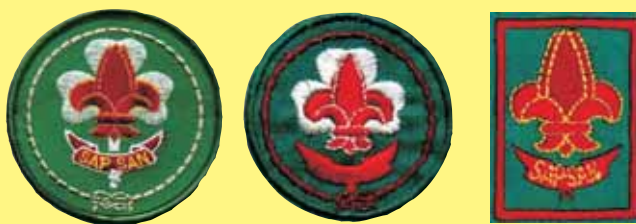
Insignias de Promesa

El movimiento Scout en Vietnam inicio en 1930, con la llegada con el gobierno socialista y la división del país en 1954 los scouts fueron prohibidos en el norte, en 1975 el Vitcom invadió el sur y así fue como quedo desbandado el movimiento dentro del país. Algunos dirigentes en el exilio crearon organizaciones en varios países y son de éstas de las que se han producido muchos materiales, como insignias y libros (inclusive escritos en idioma vietnamí) y que circulan como materiales de colección. El 31 de mayo de 1993 se realizó una reunión para restablecer el movimiento scout y así fue que comenzó a organizarse nuevamente los grupos Scouts, tropas y campamentos, ya en 1998 se dio un curso de Insignia de Madera y para el 2003 ya existían al rededor de 24 grupos funcionando, hoy día ya tienen una oficina establecida, tiendas y un proceso muy avanzado para un reconocimiento por parte del gobierno, ya existen planes específicos para el reconocimiento de la OMMS, éstas son las insignias que se usan dentro del país.