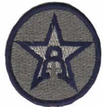
grupo - i