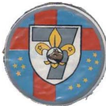
grupo - h