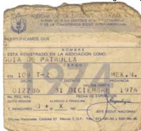
Credencial Scout de 1974

Dentro del desarrollo del pago del registro y control de la secciones, a principios de los setentas, para facilitar y acreditar que se contaba con registro, se entregaba una credencial con el numero de registro nacional, que no era mas que el numero subsecuente de miembro que pagaba a la ASMAC.