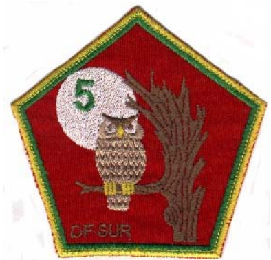
grupo - f