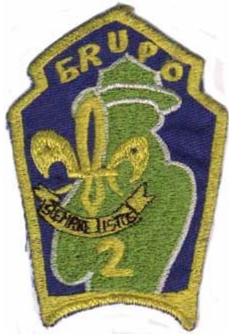
grupo - a

Por favor envía un correo electrónico con sus datos y anota la clave. salpadilla@hotmail.com