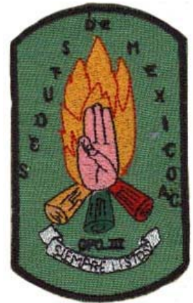
grupo - c