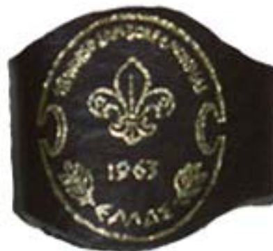
Nudo para pañoleta

Confucio el amigo del sabio Cicerón decía que: