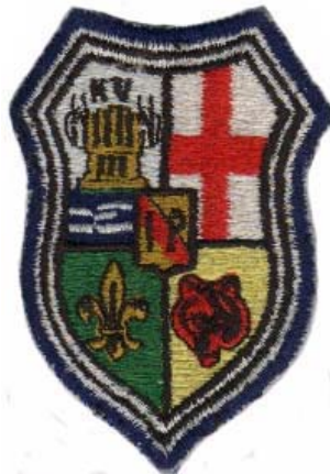
grupo - e