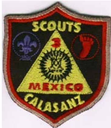
grupo - b