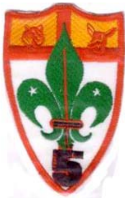
grupo - g