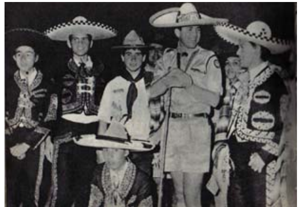
La delegación mexicana al Jamboree junto al príncipe Constantino en la noche de la fraternidad

El sabio coleccionista Ciceron escucho del Papa Juan Pablo II “ ¡Sed vosotros su mensajeros! ¡Llevad vosotros este amor a los hombres, como habéis llevado la luz de las antorchas por las calles este atardecer! Dejad que el fuego del Espíritu Santo brille en vosotros para llevar al mundo la luz y el calor del amor de Dios “ Palabras de Juan Pablo II , jubileo de los jóvenes abril 1984