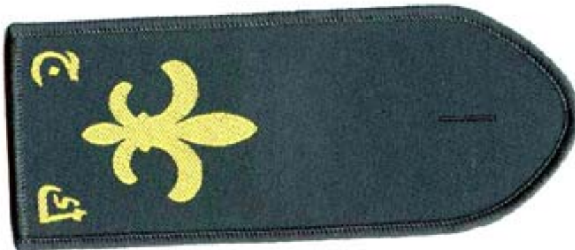
Chreteras de Rover Scout

El que aparece en la foto es Yaser Arafat con unas muchachas Scouts. E líder de la O. L. P. se convirtió en presidente del territorio y firmó la solicitud para que la Organización Scout de Palestina fuera miembro de la Organización Mundial Scout. Abajo unas insignias de Palestina.