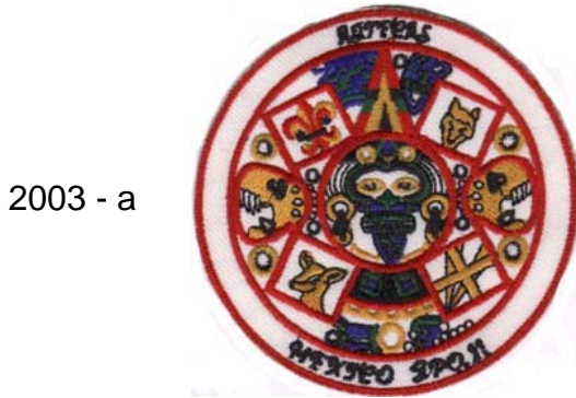
2003 - a