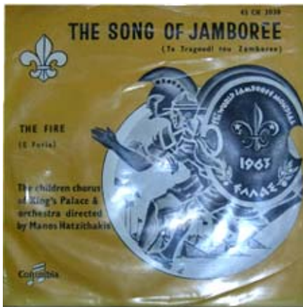
Disco de acetato con la canción del Jamboree

E l escudo de Boeotian, emblema del Jamboree fué reproducido en un sin fin de artículos conmemorativos del Jamboree y que se han convertido de alta colección. Existen algunos que por sus historias son muy buscados por los coleccionistas: