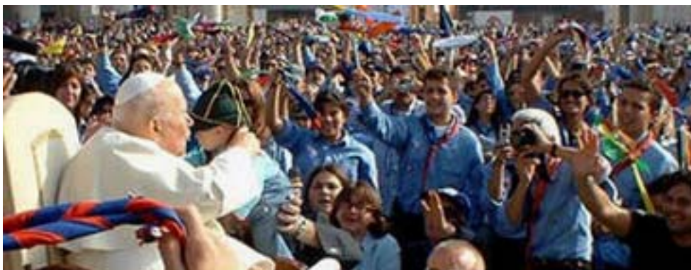
El 23 de octubre del 2004 el Papa Juan Pablo II otorgo un audiencia a los 40,000 miembros de la Asociación de Guías y Scout Catolicos Italianos (AGESCI).