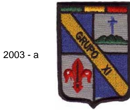
2003 - a