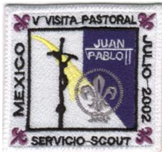
Parche conmemorativo de su quinta visita en el 2002