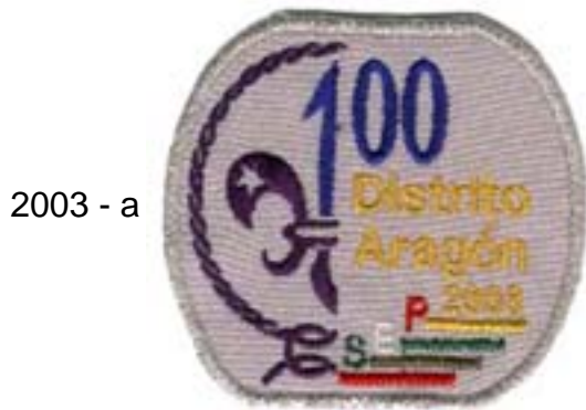
2003 - a

Por favor envía un correo electrónico con sus datos y anota la clave. salpadilla@hotmail.com